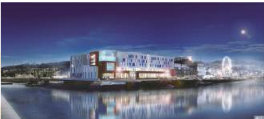
Hôtel Thalasso - Fécamp Complexe hôtelier 4 étoiles et centre de thalassothérapie 8 500 m 2