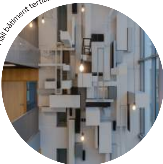
Hall bâtiment tertiaire