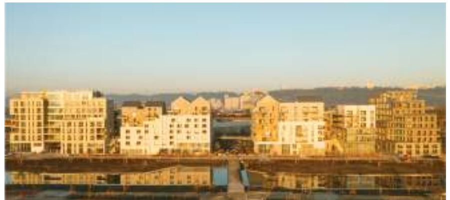
Gaia - Rouen Flaubert Mixité programmatique : logements, bureaux, tertiaire et commerces 21 000 m 2