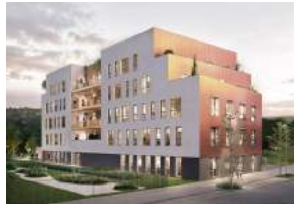
Le Clos Galien - Rouen Innovation Santé Pôle tertiaire bureau dédié à la santé 2 800 m 2