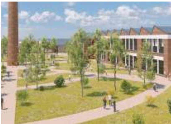
Le Campus des Métiers en Tension - Arques-la-Bataille Réhabilitation d'une friche industrielle 16 000 m 2