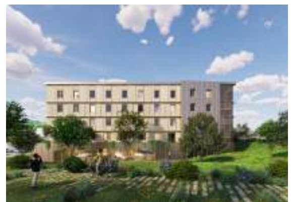
Kolysé - Louviers Mixité programmatique : logements, bureaux, tertiaire dédié aux activités secteur de la santé 13 000 m 2