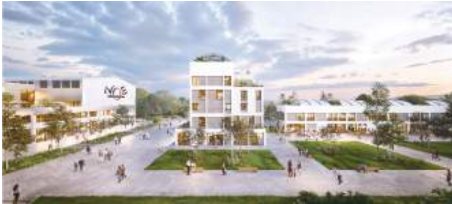
Complexe de loisirs et hôtelier - Vernon 13 000 m 2

Depuis 1978 , nous accompagnons les collectivités et relevons leurs défis pour imaginer des projets résidentiels et tertiaires innovants et ambitieux.